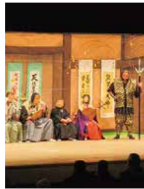
「石井の七福神と田植踊」 石井芸能保存会