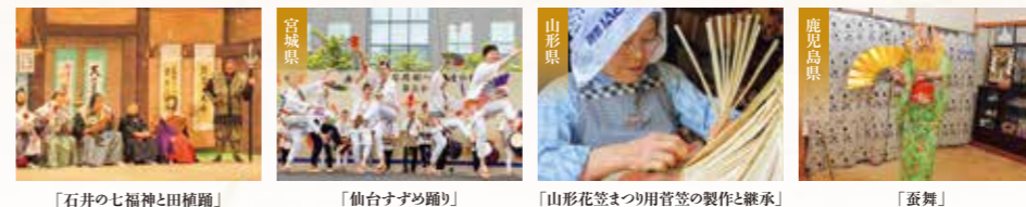
「石井の七福神と田植踊り」