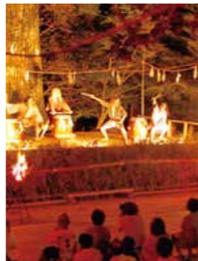
「久万山五神太鼓」 久万山五神太鼓保存会