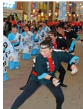
「諫早ののこの皿踊り」 諫早まつりののこの連