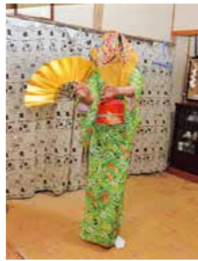
「蚕舞」 莖永校区青年団