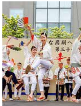
「仙台すずめ踊り」 仙台・青葉まつり協賛会