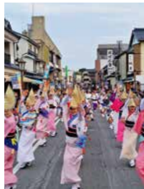
「阿波おどり」 阿波おどり振興協会